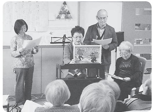
地域の語り部の皆様による紙芝居

山の恵みにあずからせて頂けた事を心から感謝致します。地域の皆様本当にありがとうございます。ごさいます。